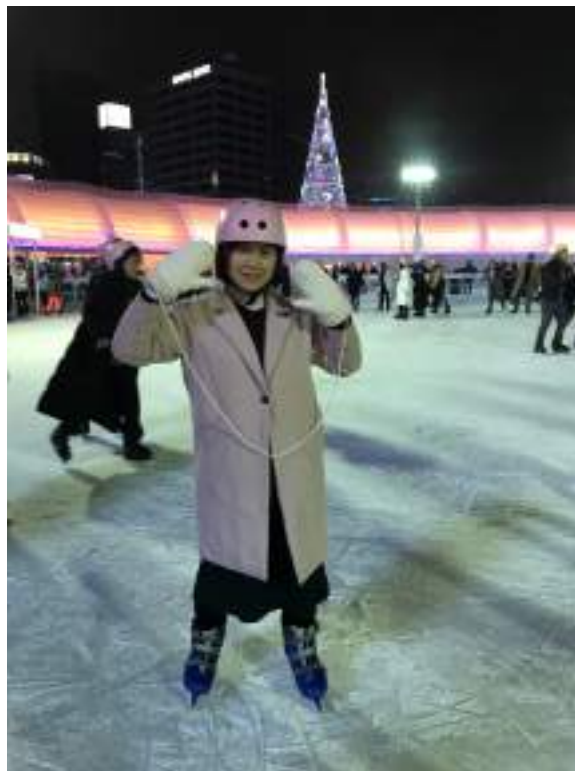
首爾廣場冬季 1000 韓幣/小時的溜冰體驗