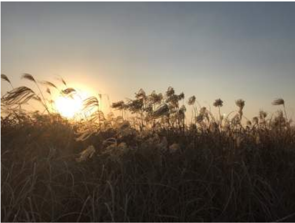
Haneul Park 日落風景