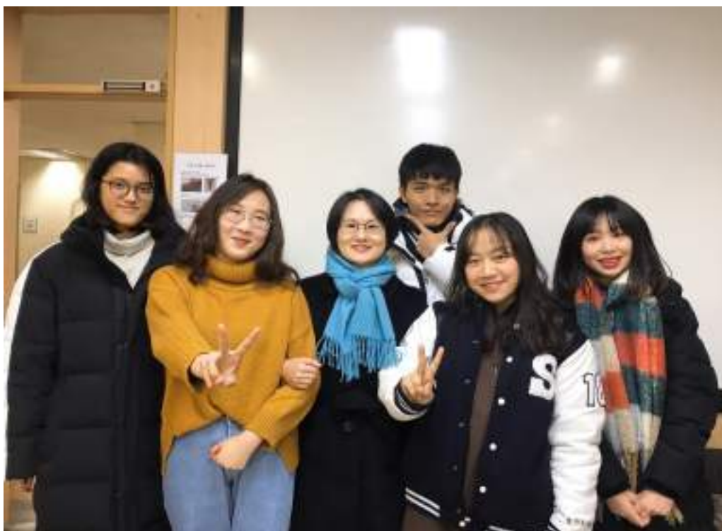
一起上中文課的台灣同學們以及韓國老師