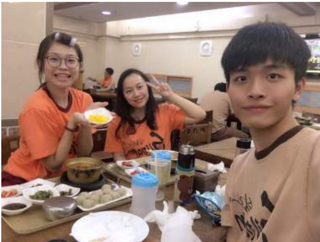
與台灣同學汗蒸幕 (Siloam Hot Spring)