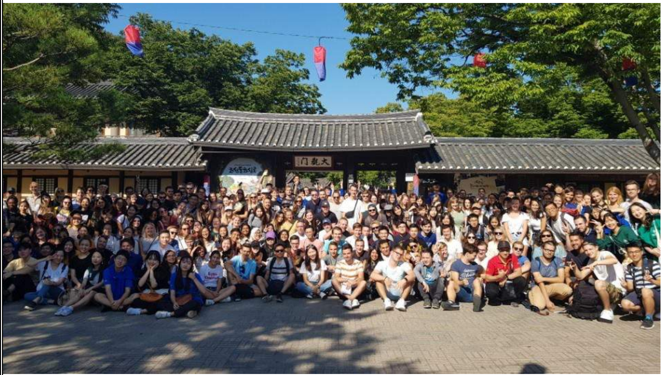
SKKU Hi-Club 免費一日遊活動（韓國民俗村）