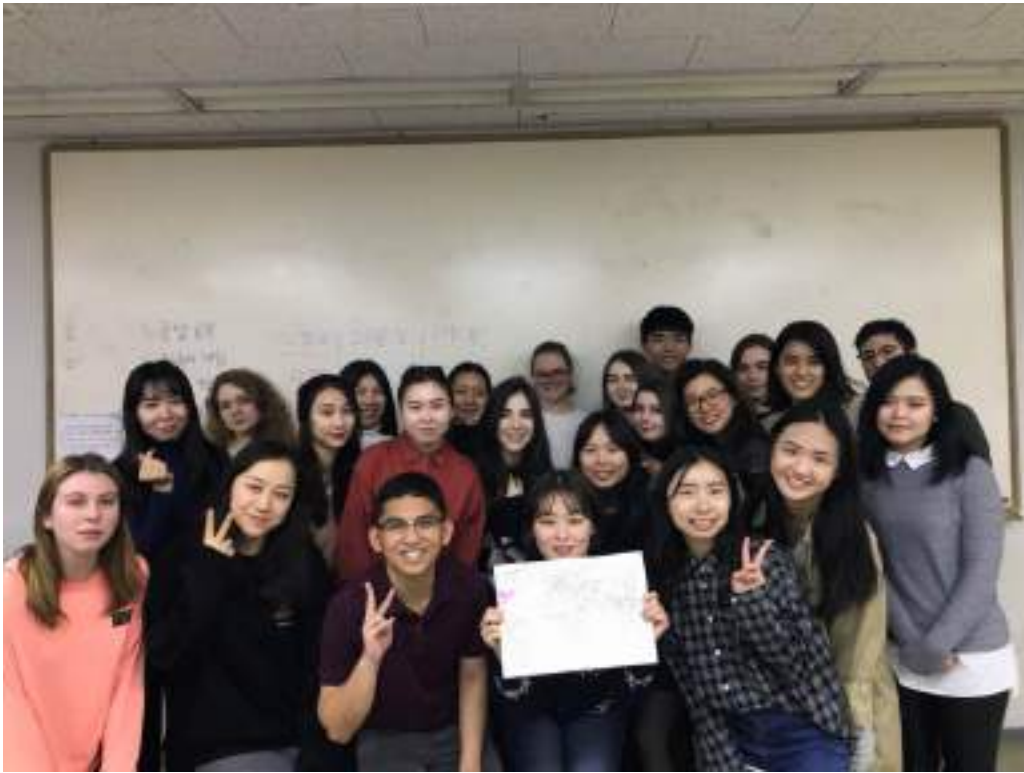
韓文班同學們跟韓文老師學期結束的合照