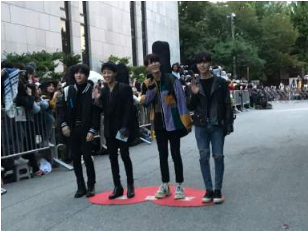
KBS 電視台早上 6 點去上班路看一些來上班的韓團