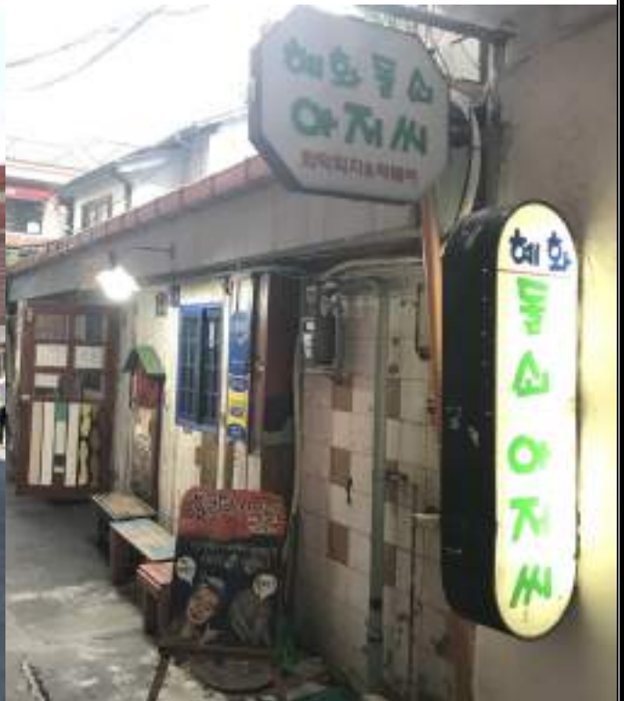
惠化站附近推薦的披薩店