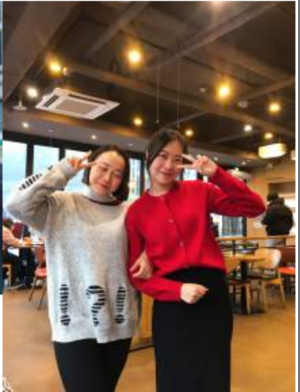
中文課認識的韓國同學