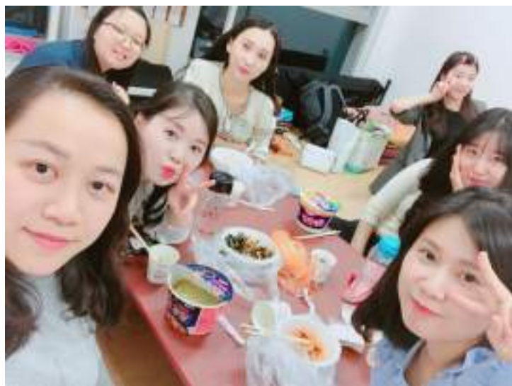
與韓國教會的姐姐們，禮拜結束一起聚會吃飯