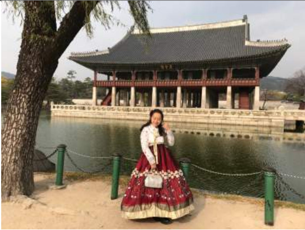
景福宮穿韓服體驗（租 4 小時 15000-20000）