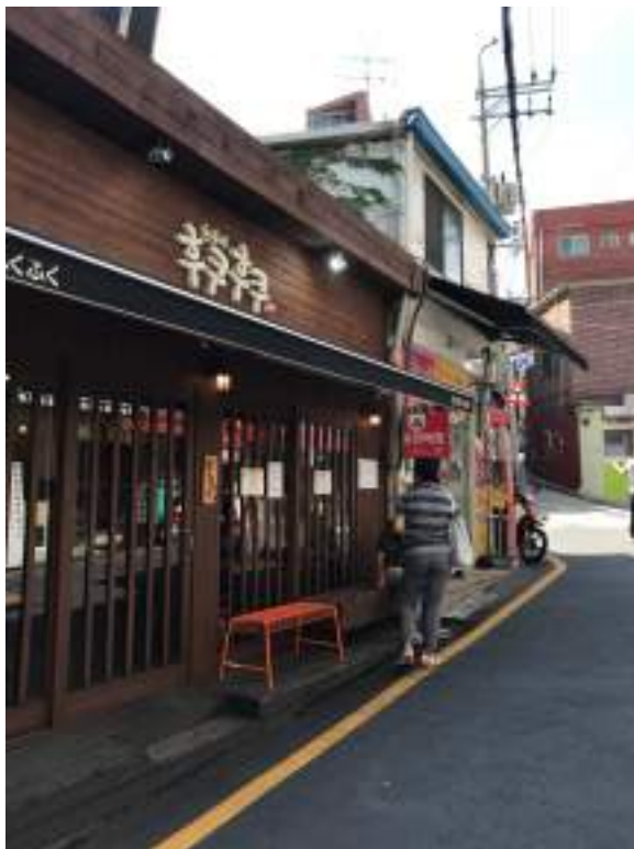
學校後門電梯推薦的餐廳