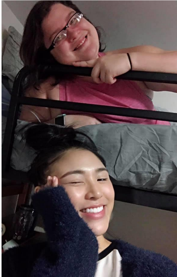
感謝我的室友天天陪我聊天 練習口說

須要天天講英文，所以英語的聽、說、讀、寫能力明顯進步很多，特別是聽與說。每個月我的美國室友都跟我說，我覺得你的英語又比上個月更進步了！