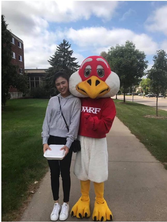
UWRP 的吉祥物 Falcon

除了運動賽事，學校還會舉辦很多好玩的活動，其中最讓我印象深刻的是 Goat Yoga，沒錯，就是跟山羊一起做瑜伽！這些都是在台灣學校不會舉辦的活動。