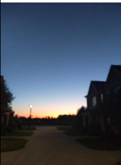
Pic3 密西根的天空是漸層的