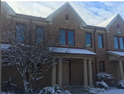
Pic1 Pine Grove 區的(獨棟)宿舍外觀