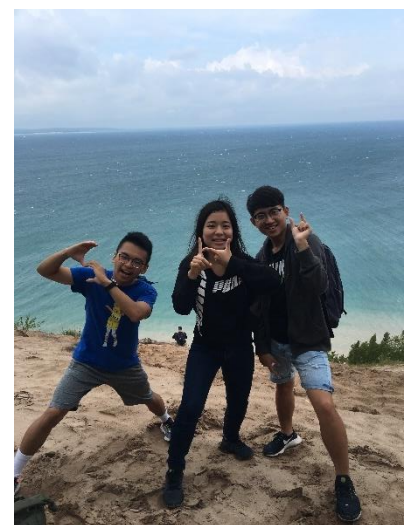
Pic5 和朋友們參加學校的旅行到密西根的 Sleeping Bear Dune