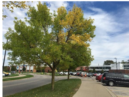
Pic2 秋天時校園的樹都會慢慢變成橘紅