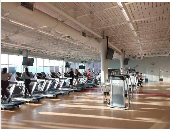
Pic9 學校健身房二樓(設備真的很多)