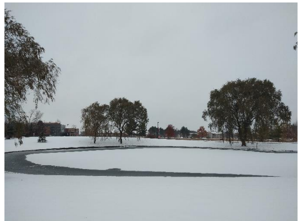
Pic10 學校的湖在冬天完全結冰