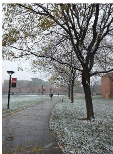
Pic4 第一場雪時校園的景色