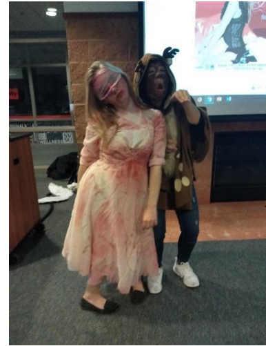
Pic8 萬聖節參加國際學生社團的