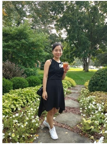
Pic7 參加校長夫人的國際