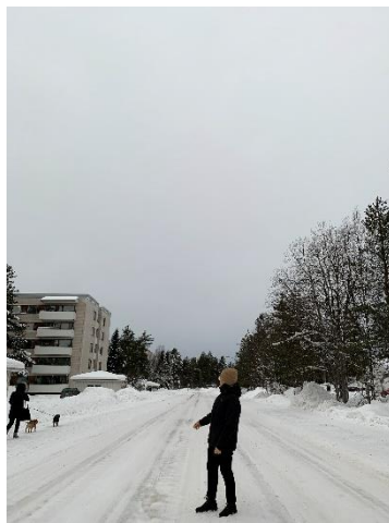
芬蘭·羅瓦涅米街景