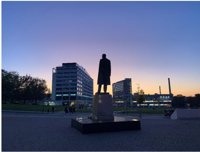
Tomas Bata University 校園