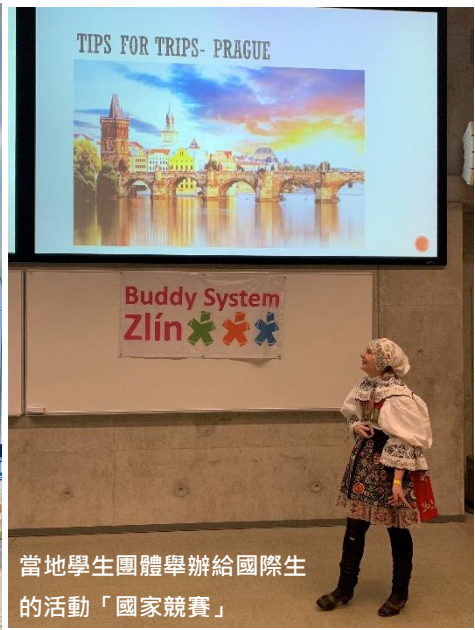
當地學生團體舉辦給國際生的活動「國家競賽」