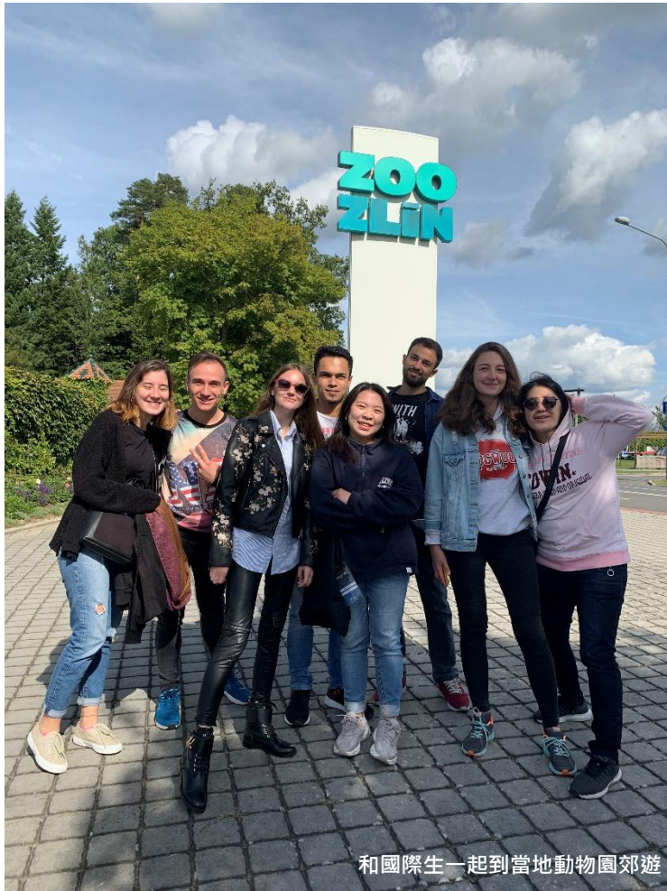
和國際生一起到當地動物園郊遊