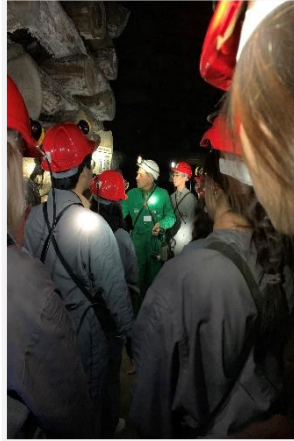
波蘭維利奇卡鹽礦-礦工體驗