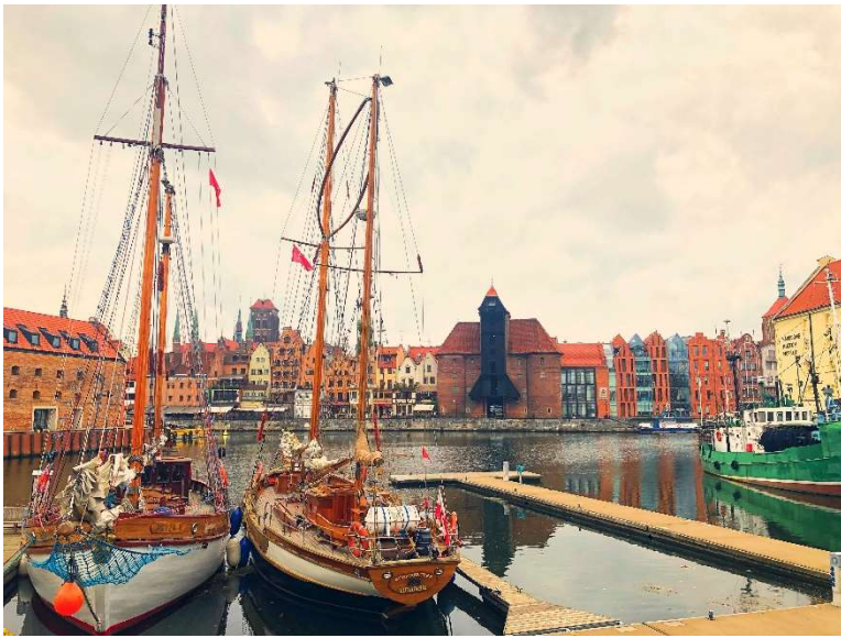
附近港口城市—格但斯克市景