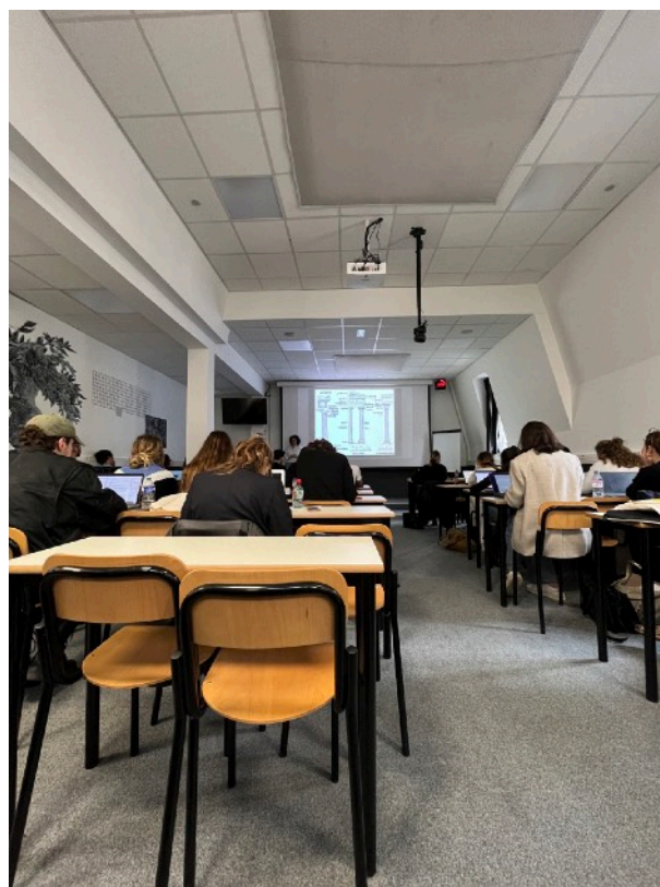
Art history 上課過程