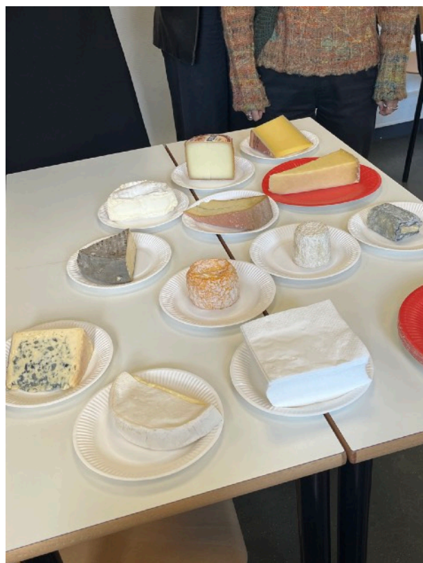
French culture 嚐法國起司

最後，（1）力推下載「小紅書app」上面會有許多有用的歐洲資訊。（2）帶上一本日記本，誠實紀錄自己的心情。