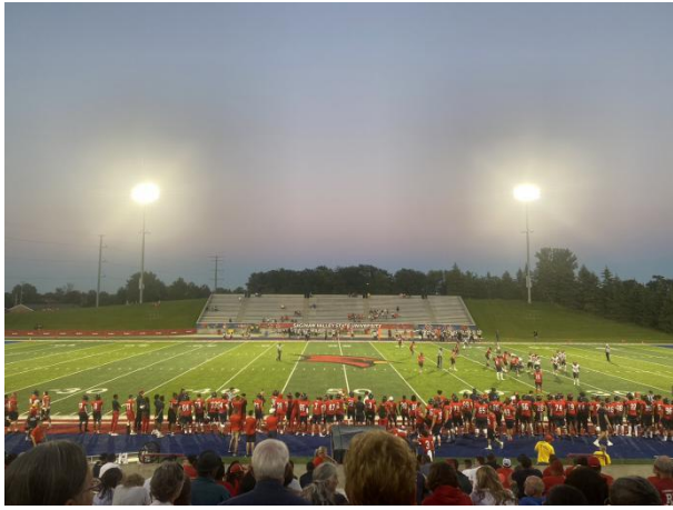
←來美國學校必看的 Football Game